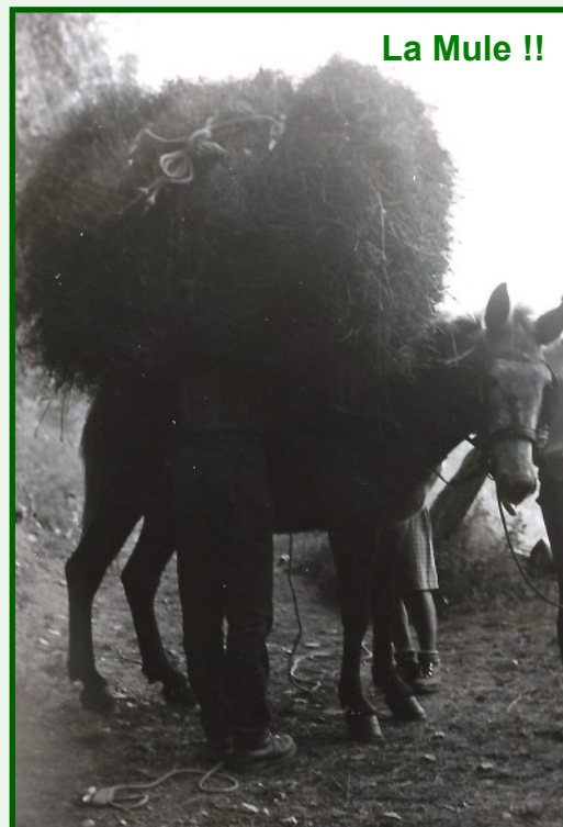
La Mule !!