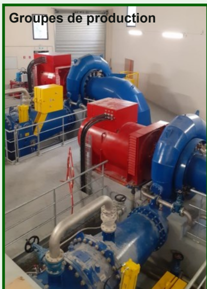
Groupes de production

L'usine fonctionne en automatique selon les ordres des services généraux et en fonction des conditions hydrologiques et des consignes. En fonctionnement normal, la régulation de niveau amont est faite de façon à assurer un niveau amont constant de 1115,80 mN GF dans la chambre de mise en charge. Chaque groupe fonctionne indépendamment en régulation de niveau et en fonction de leur ordre de priorité. En mode automatique, l'usine s'arrête à la cote basse 1118,22 mN GF. Les alarmes sont transmises de façon automatique, à destination de l'exploitant.