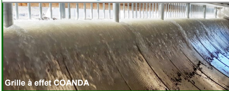
Grille à effet COANDA