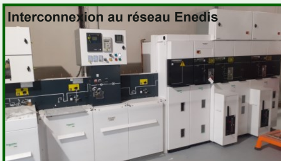
Interconnexion au réseau Enedis