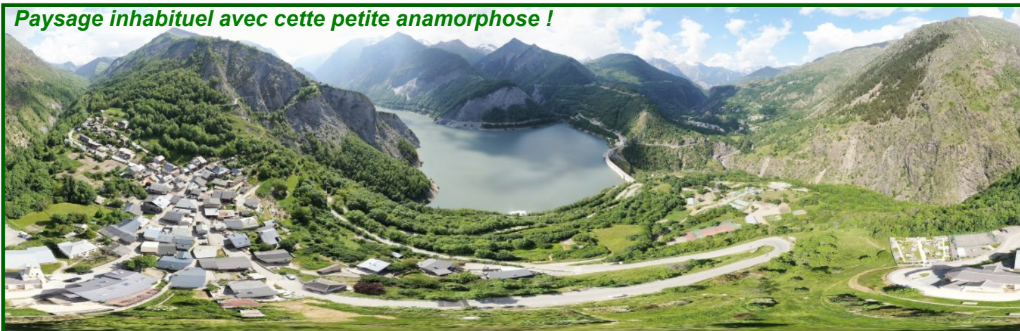
Paysage inhabituel avec cette petite anamorphose !