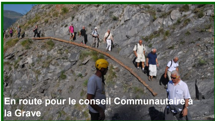
En route pour le conseil Communautaire à la Grave

En septembre 2015, il a été annoncé que la réparation du tunnel était abandonnée au profit de la construction d'un nouveau tunnel de dérivation, plus profond dans la montagne, pour contourner la zone instable. Parallèlement, une route de secours sur la rive gauche a été aménagée en urgence. Contre toute attente, cette route (RS 1091) fut ouverte le 24 novembre 2015, rétablissant une liaison locale.