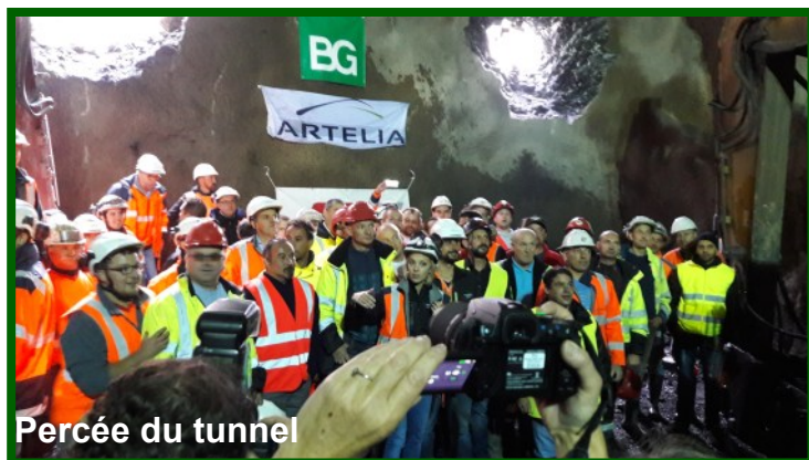
Percée du tunnel

Fin octobre 2016, achèvement du percement du nouveau tunnel.