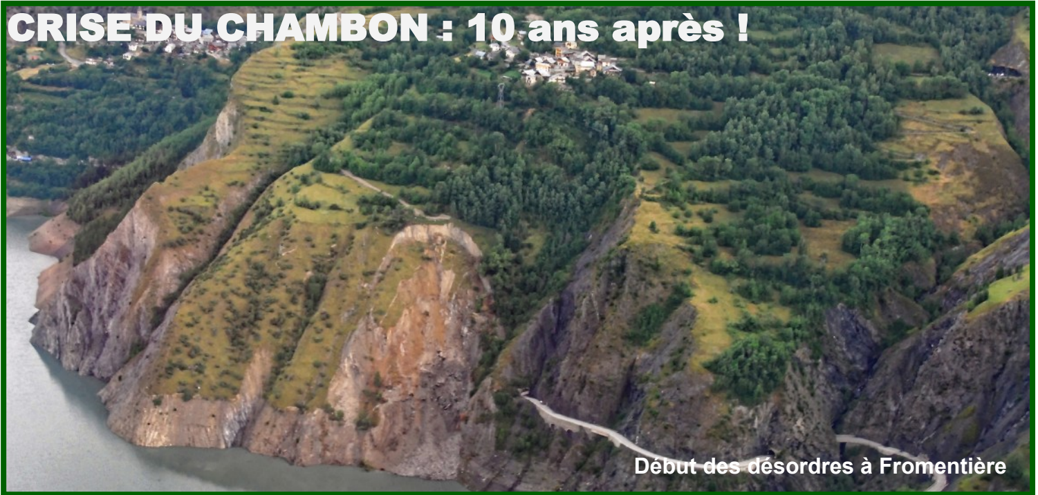
Début des désordres à Fromentière

Le 10 avril 2015, la route départementale 1091 (ancienne RN 91), un axe vital reliant l'Isère aux Hautes-Alpes et à l'Italie, fut fermée au niveau du grand tunnel du Chambon en raison de fissures et de mouvements géologiques inquiétants.