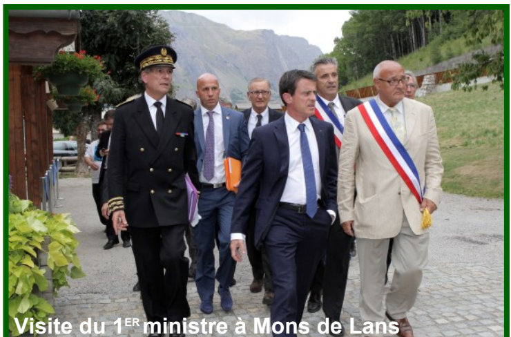
Visite du 1 ER ministre à Mons de Lans

Le Premier Ministre, Manuel Valls, a visité les lieux en juillet, et l'état de catastrophe naturelle a été reconnu pour trois communes des Hautes-Alpes début août, une démarche inhabituelle pour préjudice économique sans sinistre direct.