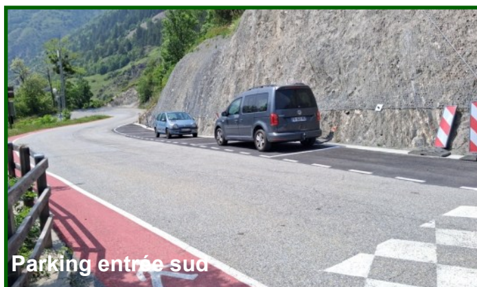
Parking entrée sud