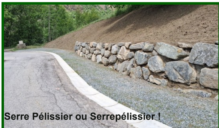
Serre Pélissier ou Serrepélissier !

Enfin, après quelques modifications de conception, les parkings sont terminés : 8 places à l'entrée Sud de Mizoën et 7 à 8 places à Serre Pélissier.